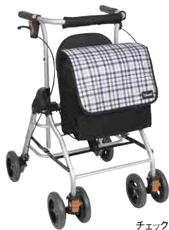
チェックブラック